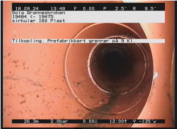
Granneskroken_19484_50215.jpg, 00:03:00, 26.33m Tilkopling. Prefabrikkert grenrør på 9 Kl.