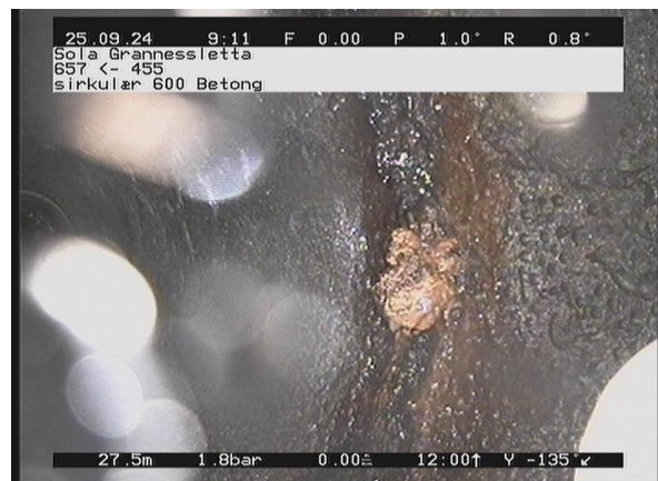
Grannessletta_657_3290.jpg, 00:04:03, 27.54m Reduksjon i tverrsnittsareal er 5 % eller mindre, utfelling på 2 Kl.