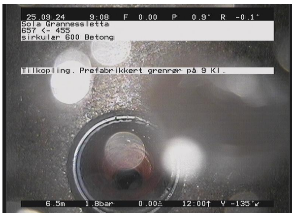
Grannessletta_657_47768.jpg, 00:01:41, 6.59m Tilkopling. Prefabrikkert grenrør på 9 Kl.