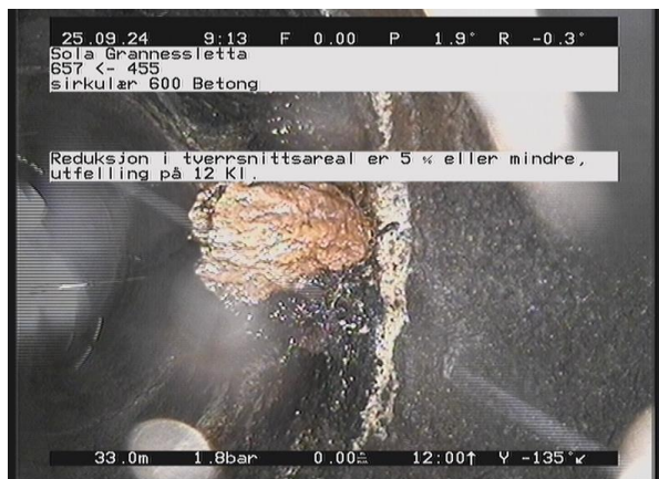
Grannessletta_657_56402.jpg, 00:05:52, 33.02m Reduksjon i tverrsnittsareal er 5 % eller mindre, utfelling på 12 Kl.