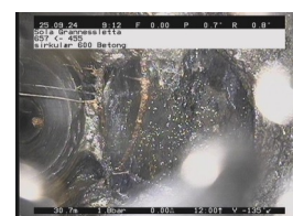
SB3 - 30,74 m