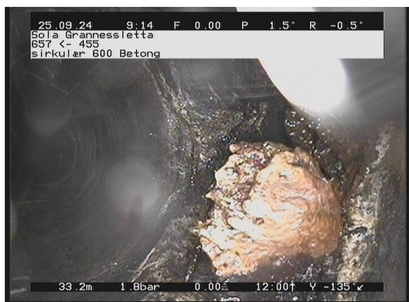
Grannessletta_657_56231.jpg, 00:06:05, 33.43m Rørbiter har løsnet eller mangler, utstrekning 2 - 4 timer, kompleks av 11 Kl. til 1 Kl.