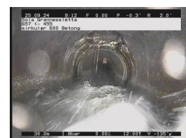
SB3 - 30,74 m