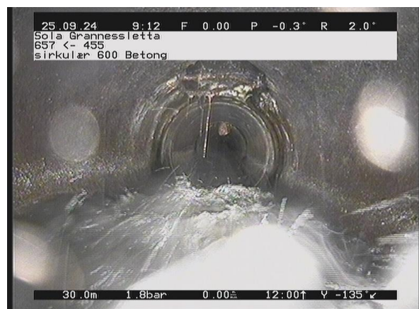
Grannessletta_657_60614.jpg, 00:04:40, 30.74m Rørbiter har løsnet eller mangler, utstrekning 2 - 4 timer av 11 Kl. til 1 Kl.