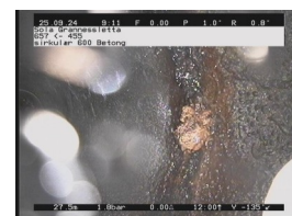
UB1-U - 27,54 m