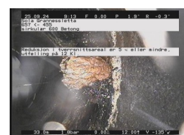
UB1-U - 33,02 m