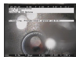
TK-PG - 6,59 m