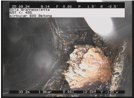
SB3-K - 33,43 m