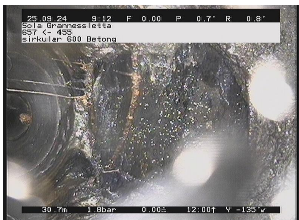
Grannessletta_657_53113.jpg, 00:04:40, 30.74m Rørbiter har løsnet eller mangler, utstrekning 2 - 4 timer av 11 Kl. til 1 Kl.