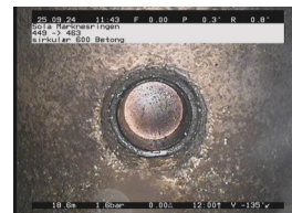
PT - 18,63 m