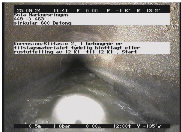
Marknesringen_449_39634.jpg, 00:00:15, 0.50m Korrosjon/Slitasje 2, I betongrør er tilslagsmaterialet tydelig blottlagt eller rustutfelling av 12 Kl. til 12 Kl., Start