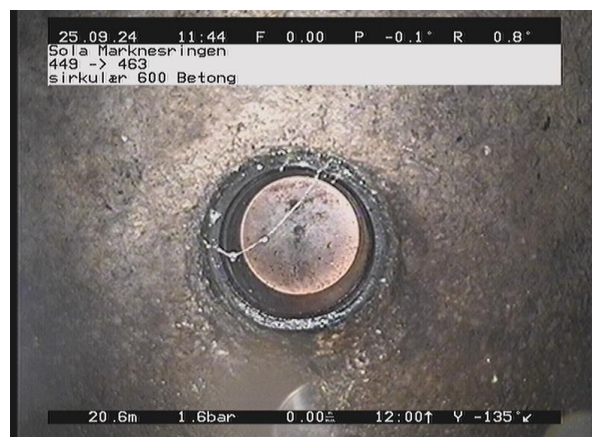
Marknesringen_449_34612.jpg, 00:03:00, 20.62m Plugget tilkobling på 9 Kl.