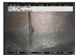
SB1 - 11,57 m