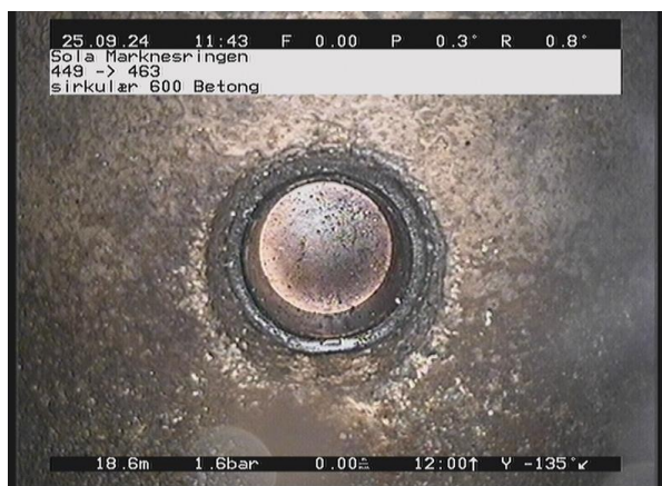
Marknesringen_449_45307.jpg, 00:02:34, 18.63m Plugget tilkobling på 3 Kl.