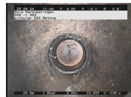
PT - 20,62 m