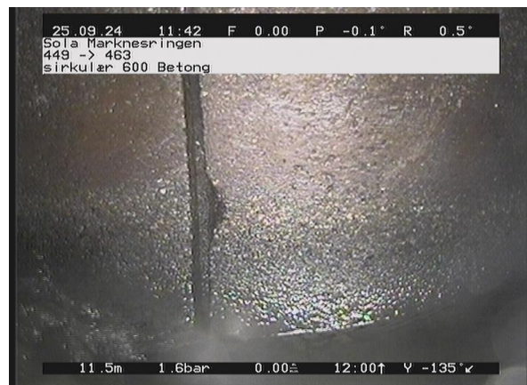
Marknesringen_449_8179.jpg, 00:01:33, 11.57m Avskalling i stive rør eller teglstein er delvis løse på 3 Kl.