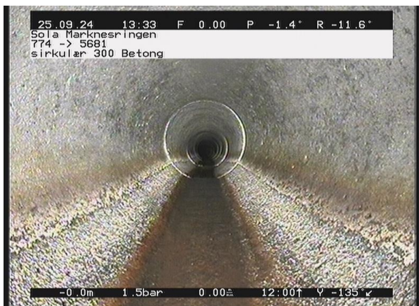
Marknesringen_774_12451.jpg, 00:00:12, 0.20m Korrosjon/Slitasje 2, I betongrør er tilslagsmaterialet tydelig blottlagt eller rustutfelling av 12 Kl. til 12 Kl., Start