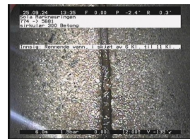
IU3-S - 6,00 m