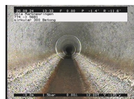
KS2 - 0,20 m