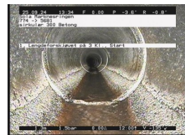
FS1-L - 1,31 m