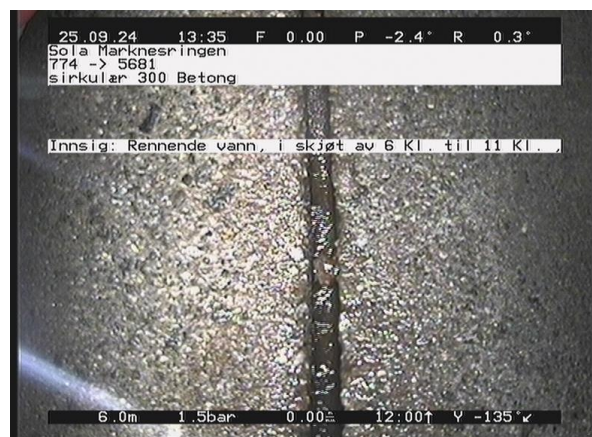
Marknesringen_774_14434.jpg, 00:01:57, 6.00m Innsig: Rennende vann, i skjøt av 6 Kl. til 11 Kl. ,