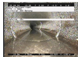
VN - 10,95 m