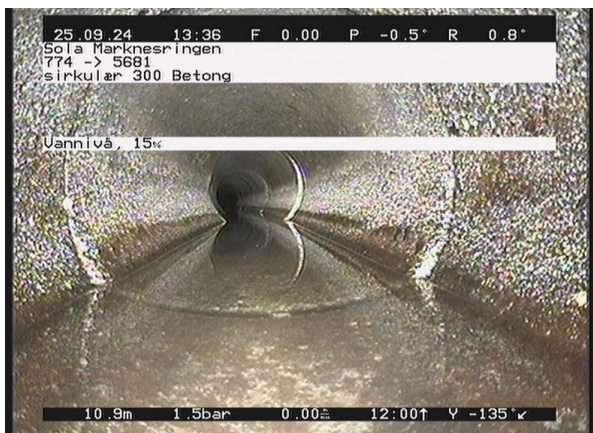
Marknesringen_774_22749.jpg, 00:02:54, 10.95m Vannivå, 15%