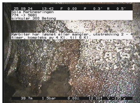
Marknesringen_774_28030.jpg, 00:07:53, 39.74m Rørbitar har løsnet eller mangler, utstrekning 2 - 4 timer, kompleks av 4 Kl. til 6 Kl.