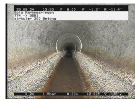
KS2 - 0,20 m