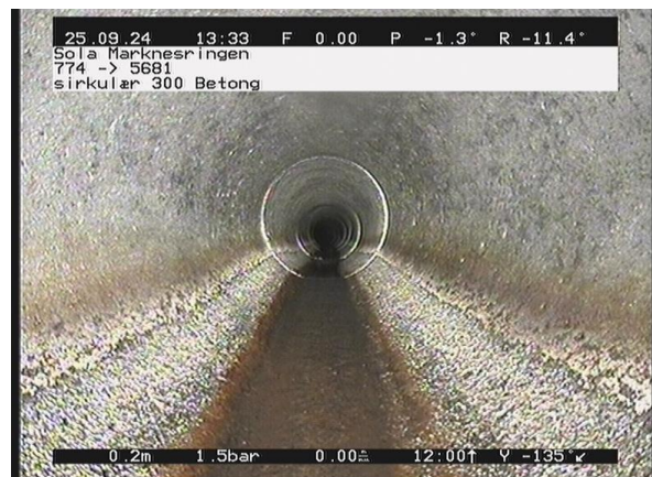
Marknesringen_774_30079.jpg, 00:00:12, 0.20m Korrosjon/Slitasje 2, I betongrør er tilslagsmaterialet tydelig blottlagt eller rustutfelling av 12 Kl. til 12 Kl., Start