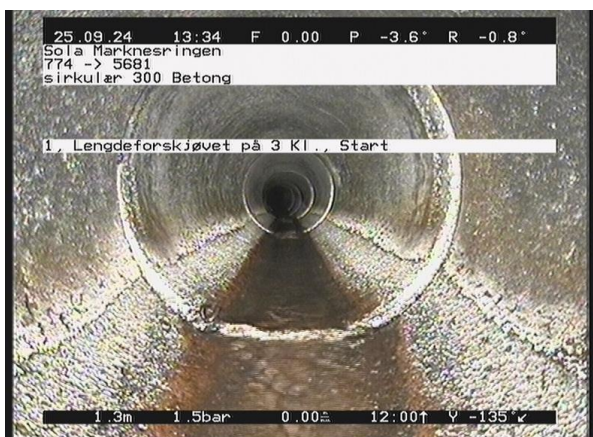
Marknesringen_774_56979.jpg, 00:01:09, 1.31m 1, Lengdeforskjøvet på 3 Kl., Start