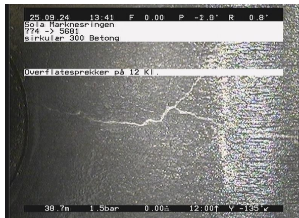
Marknesringen_774_22737.jpg, 00:07:25, 38.72m Overflatesprekker på 12 Kl.