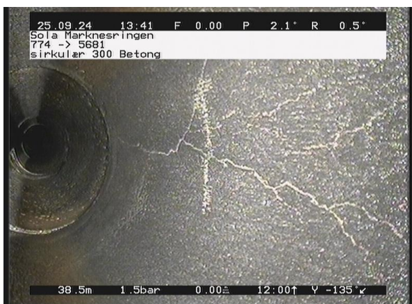
Marknesringen_774_13057.jpg, 00:07:25, 38.72m Overflatesprekker på 12 Kl.