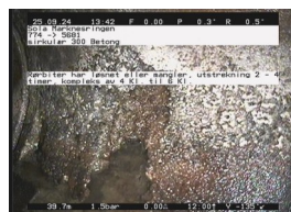
SB3-K - 39,74 m